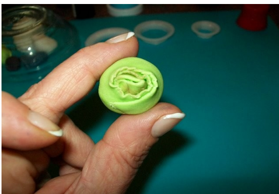
Bei dem Blütenstempel das Innenteil mit Aubergine bepudern und einer kleinen Schere den äußeren Rand einschneiden